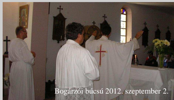
Bogárzói búcsú 2012. szeptember 2.