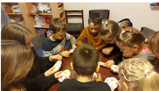
GYEP A PLÉBÁNIÁN