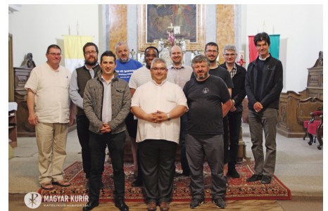
20 ÉVES AZ EGYHÁZMEGYÉS PAPOK KÖRE

"Isten temploma szent, s ti vagytok az." (1Kor 3,17)