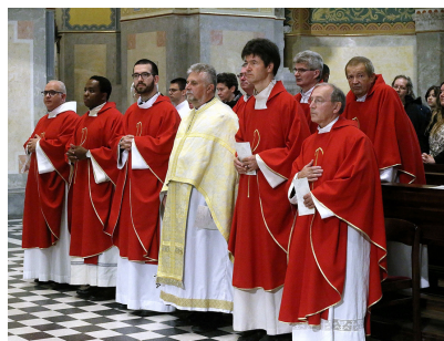
RÉSZTVEVETTÜNK A KATTÁRS RENDEZVÉNYEIN