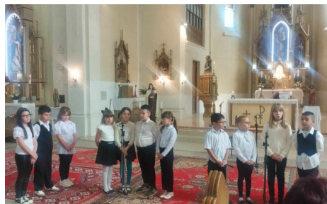
Anyák napja Újvároson