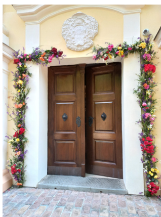
PÜNKÖSDI KAPU 2024.