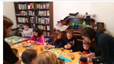
KÉZMŰVESKEDÉS A PARÓCHIÁN