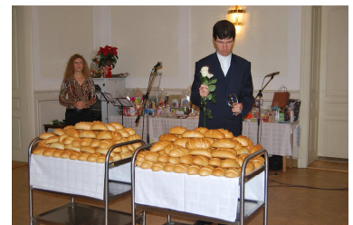
Kenyérszentelés a Szent Erzsébet-bálon