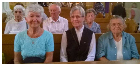
Makói hívek csoportja Őcsanádán