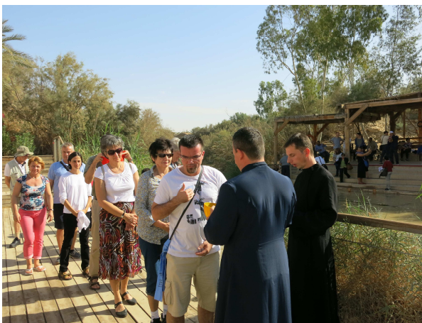
Keresztelési fogadalom megújítása a Jordán folyónál