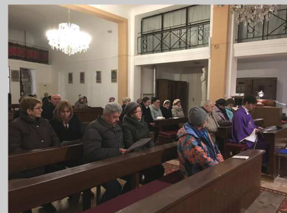
Szállást keres a Szent Család