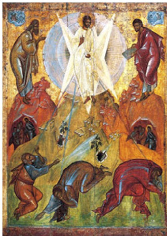
Urunk színeváltozása ikon (Feofan Grek iskolája, XV. Sz.)

apostolt: Pétert, Jakabot és Jánost, amint Jézus dicsőségének sugárzásától megvakulnak, a földre esve szemüket eltakarják a fénytől (Jakab és János), illetve egyikük (Péter) elragadtatásában néz fölfelé. Ugyanők láthatóak a kis részleteken is: az ikonok ugyanis nem egyetlen cselekményt ábrázolnak, hanem színopszisban (egy képen több eseményt megjelenítve) mutatják be a történet előzményét és folytatását: a hegy egyik részén Krisztus három apostolával megy fölfelé a Tábor-hegyre;