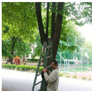
Bagolymentés a plébánián