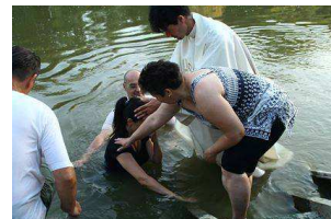
Keresztelés a Maros-Parton