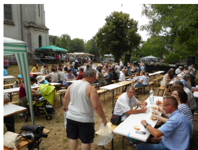
Szent László király-búcsú Újvároson