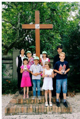
A Gyermekmissziós Tábor idei díjazottjai