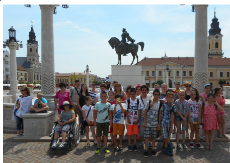
Újvárosi hittanosok Nagyváradon