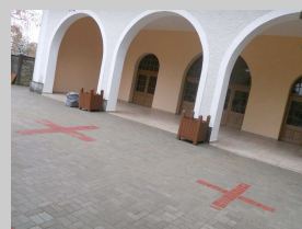
A RAVATALOZÓ ELŐTTI ÚJ TÉRBURKOLAT