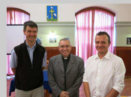
AZ EGYHÁZAK ÉVE

A szeged-alsóvárosi templomnak sohasem volt Havi Boldogasszony képe, ugyanis pápai kiközösítés terhe alatt 1572-ig tilos volt a római kegykép másolása. A másolási tilalmat Csepregi Imre is tudta, ezért azt a hipotézist állította fel, hogy egy korábbi szentkép lehetett mind a római és mind a makói festmény előképe, nevezetesen Cimabue Firenzében őrzött Madonnája.