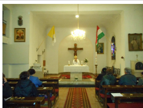
Szentségimádás a Kiskápolnában