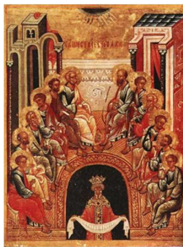
A Szentlélek eljövetele (ikon Novgorodból)

Más szláv népeknél az ünnep megnevezése az akkor történt