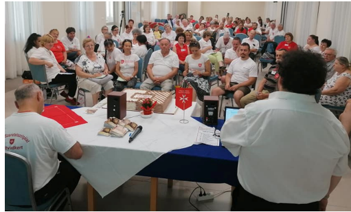
Máltai Lelkinap Makón 2021.