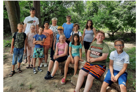
Újvárosi Hittanos Tábor 2021.