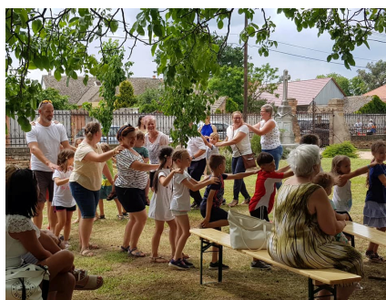
Hittanos tábor 2021.