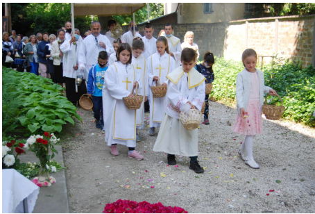
Úrnapi körmenet 2021.

Keresse honlapunkat: www.makobelvaros.hu