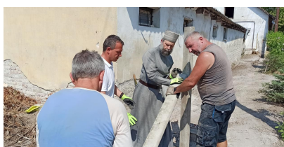
Kerítésbontás Kocsis Fülöp Érsek Atyával 2021. nyarán