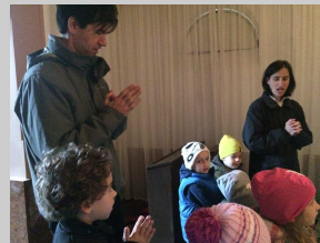
ZRÍNYI ÓVODÁSOK A SZENT SÍRNÁL